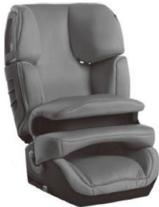
图1 典型的前置护体类型儿童安全座椅

3、翻转测试。GB 27887要求进行540°翻转后，假人不得从装置中掉出，并且当试验座椅处于翻转位置时，假人头部从它的原始位置产生的位移不得超过300mm。而ECE R44在2015年修订的时候要求在相同条件下额外增加了在翻转的位置时须额外加载4倍假人重量。ECE R44此项要求对使用前置护体类型的座椅（见图1）提出了更高的要求，主要是源于2014年欧盟发生的一起事故中儿童乘员从前置护体类型的儿童座椅中脱落导致失去保护作用的召回案例。