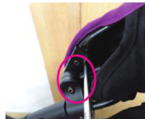
▲ 图 2：遮阳篷相对移动部件

如图 2，遮阳篷的相对移动部件间隙大于 5mm 但小于12mm，在 EN 1888-1:2018 中判定为不合格，而在 GB 14748-2006 判定为不适用。