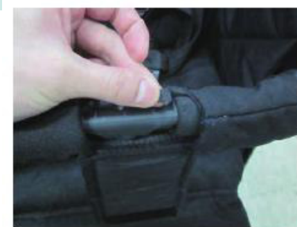
▲ 图 3：扶手填充物脱落

如图 3，该推车小部件在进行 70N 拉力测试没有脱落，但进行了 0.34\text{N}\cdot\text{m} 扭力测试后脱落并形成小零件，所以这款产品只能满足 GB 14748-2006 而不能满足 EN 1888-1:2018。