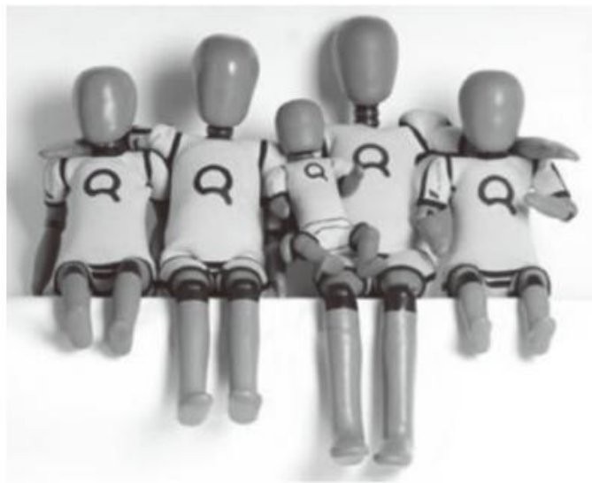
图3 ECE R129的Q系列假人