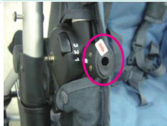
▲ 图 1：危险间隙

如图 1，该孔的直径是 6mm，深度大于 10mm，在 GB 14748-2006 中会判定为危险孔洞，而在 EN 1888-1:2018 中不会判定为危险孔洞。