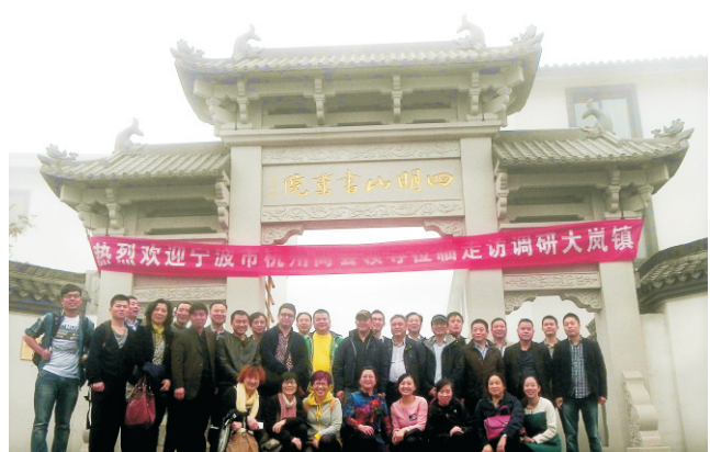
“践行党的群众路线 深入大岚镇走访调研”活动