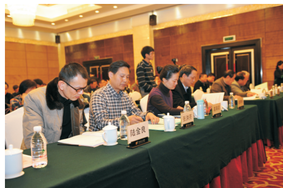
杭甬两地工商联领导参加第二届会员代表大会