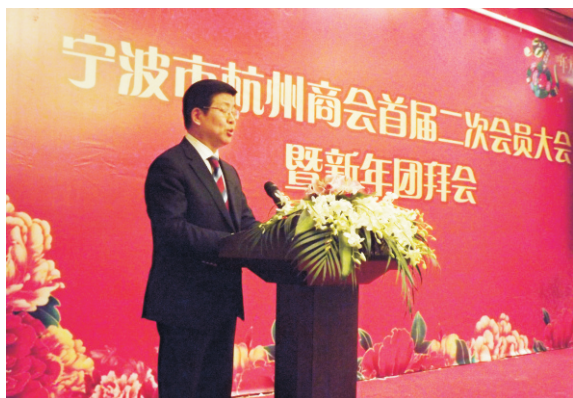
第一届第二次会员代表大会