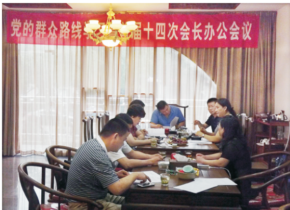
“党的群众路线学习”活动