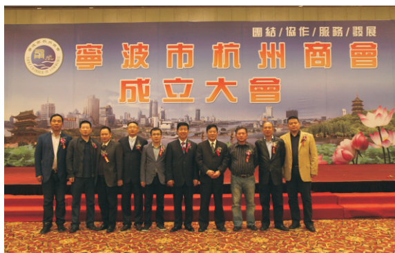
宁波市杭州商会第一届会长团队合影