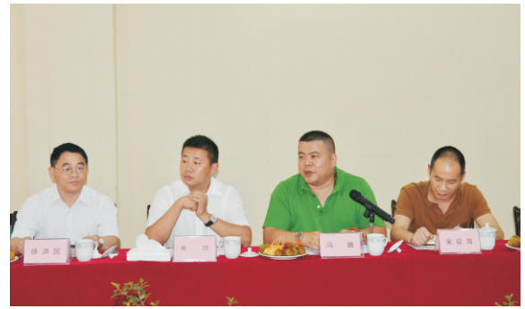
“老乡帮老乡 发展有商量”交流会