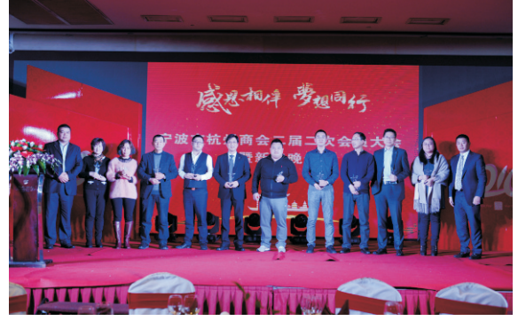
第二届第二次会员代表大会