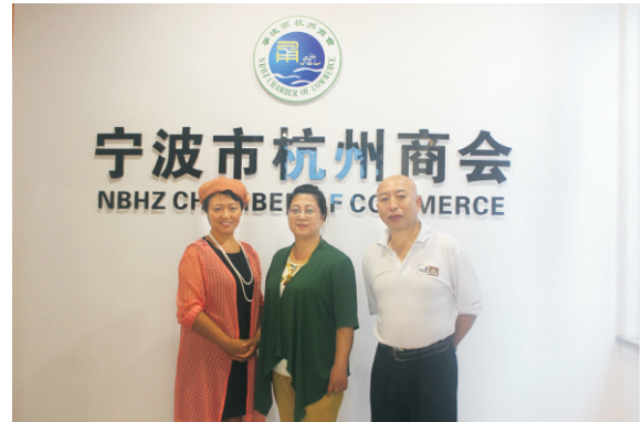
宁波市山西商会和宁波市天台商会前来交流