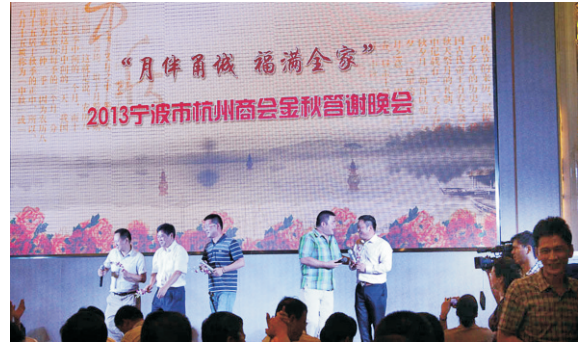
举办“月伴甬城福满全家”2013金秋答谢会