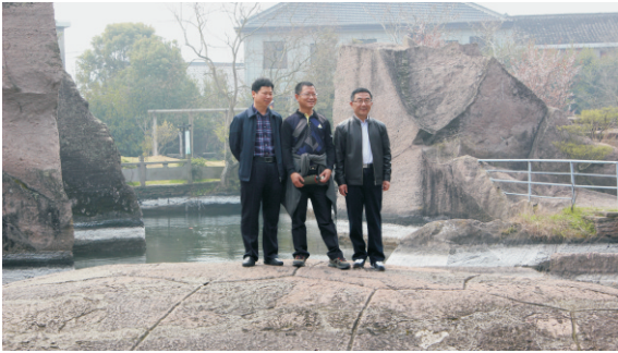
“自古千里 决胜商道”踏青活动