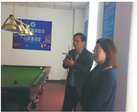
宁波市山东商会来访