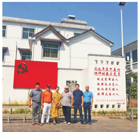
“不忘初心 为家乡谋幸福”走访活动