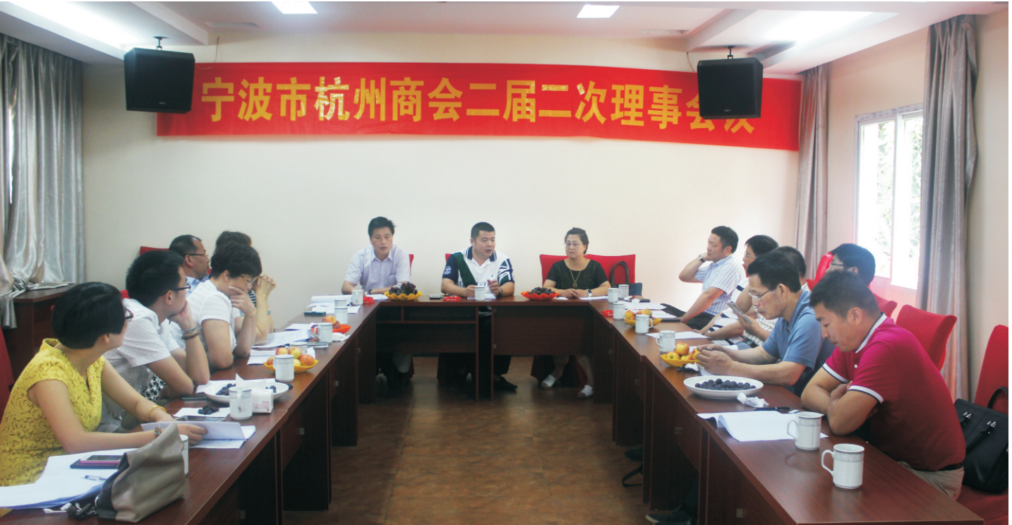
宁波市杭州商会第二届二次理事会议