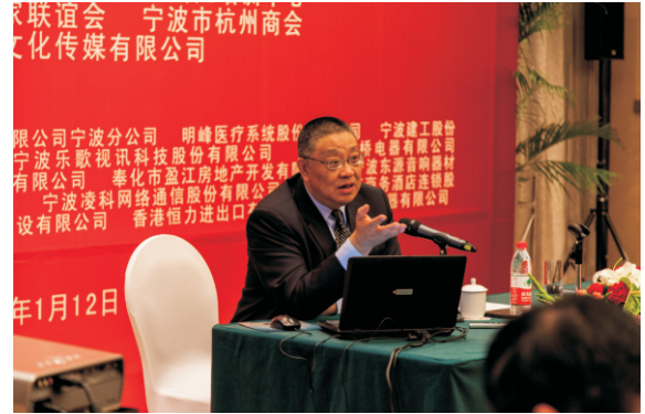
北大萧国亮教授的“中国今后五年经济发展走势分析”专题报告会