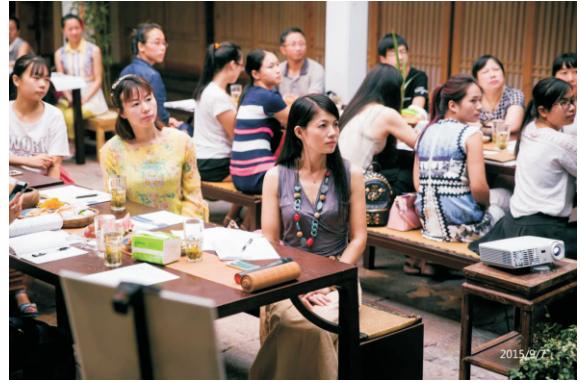
“社团文化建设职业培训”活动