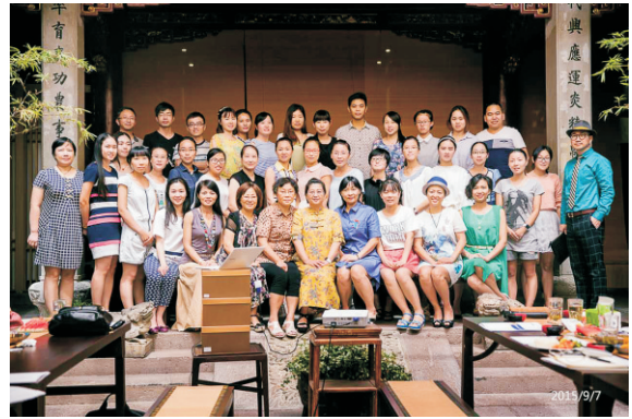
“如何打造高凝聚力的企业”和“战略转型时的企业管理升级”培训活动