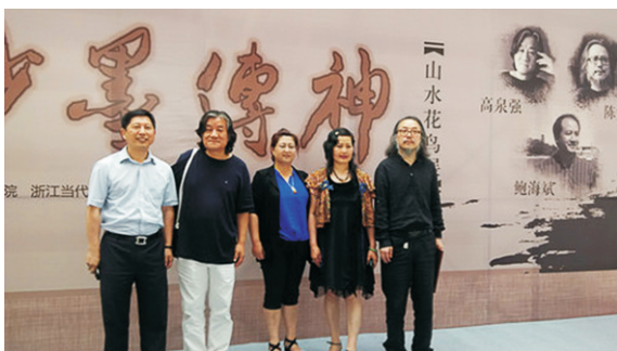
参与“高泉强、鲍海斌”等名家名画展