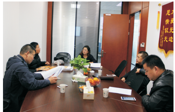
宁波市杭州商会第二届第二次监事会议