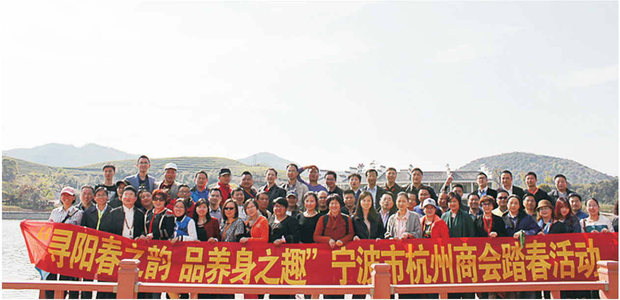
“寻阳春之韵 品养身之趣”踏春活动